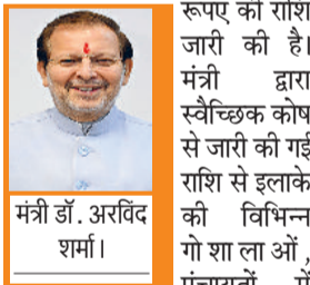
मंत्री डॉ. अरविंद शर्मा।

गोहाना। सहकारिता, कारागार, निर्वाचन, विरासत व पर्यटन मंत्री डॉ. अरविंद शर्मा ने सामाजिक, धार्मिक संगठनों तथा आमजन की मांगों को पूरा करते हुए विभिन्न विकास कार्यों के लिए 2 करोड़ रूपए की राशि जारी की है। मंत्री द्वारा स्वेच्छिक कोष से जारी की गई राशि से इलाके की विभिन्न पंचायतों में विभिन्न विकास कार्यों को पूरा करवाया जाएगा। सहकारिता मंत्री डॉ. अरविंद शर्मा द्वारा स्वेच्छिक कोष के माध्यम से मंजूर की गई राशि प्रशासन के माध्यम से विभिन्न संगठनों व पंचायतों को भेज दी गई है। कैबिनेट मंत्री डॉ. अरविंद शर्मा द्वारा रोहतक रोड गोहाना स्थित नंदीग्राम सेवा संस्थान में शौड निर्माण के लिए 11 लाख जारी किए गए।