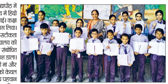
गननौर। प्रतियोगिता में लिखे गए लेख दिखाते स्कूल के छात्र।