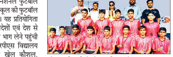
महेन्द्रगढ़। खिलाड़ियों को सम्मानित करते हुए।

महेन्द्रगढ़। सीबीएसई द्वारा आयोजित नेशनल फुटबॉल टूर्नामेंट में आरपीएस सीनियर सेकेंडरी स्कूल की फुटबॉल टीम ने ब्रॉन्ज मेडल अपने नाम किया। यह प्रतियोगिता भोपाल में आयोजित की गई, जहाँ विदेशों एवं देश से विभिन्न राज्यों व क्लब्स की श्रेष्ठ टीम भाग लेने पहुंची थी। चैम्पियन मुकामों के बीच आरपीएस विद्यालय महेन्द्रगढ़ की टीम ने अपने उत्कृष्ट खेल कौशल, अनुशासन और टीम भावना के बल पर तीसरा स्थान हासिल किया। विद्यालय के खिलाड़ियों ने न केवल विद्यालय का मान बढ़ाया, बल्कि जिले और प्रदेश का नाम भी राष्ट्रीय व अंतरराष्ट्रीय स्तर पर रोशन किया। खिलाड़ियों के इस ऐतिहासिक प्रदर्शन से विद्यालय तथा क्षेत्रवासियों में