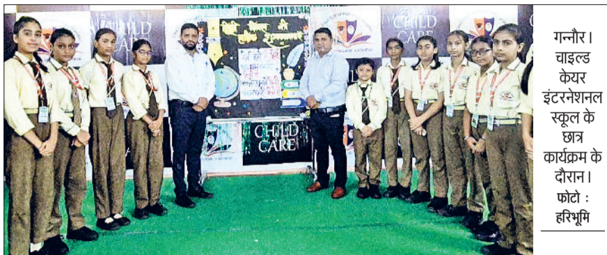
गननौर। चाइल्ड केयर इंटरनेशनल स्कूल के छात्र कार्यक्रम के दौरान।

चाइल्ड केयर इंटरनेशनल स्कूल में हिंदी दिवस उत्सव धूमधाम से मनाया गया। विभिन्न सांस्कृतिक एवं शैक्षिक गतिविधियों का आयोजन किया गया। कार्यक्रम की शुरुआत सरस्वती वंदना से हुई, जिसके बाद विद्यार्थियों ने हिंदी भाषा के महत्व पर भाषण, कविताएँ, नाटक और वाद-