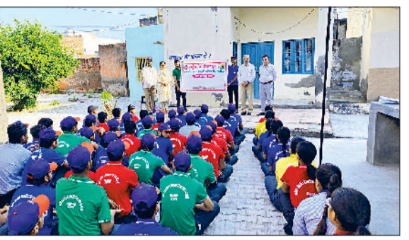
सोनीपत। अस्पताल में लगी मरीजों की लंबी लाइन तथा मॉडल टाउन स्थित स्कूल में बच्चों को जागरूक करते हुए।

बाद के कारण स्थिति और अधिक गंभीर हो गई है। ऐसे इलाकों में