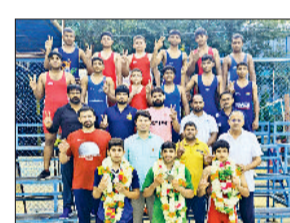
खरखोदा। खिलाड़ियों का स्वागत करते हुए स्कूल प्रबंधन।