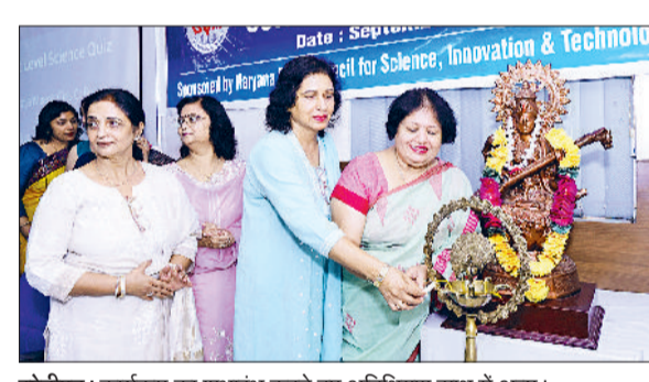
सोनीपत। कार्यक्रम का शुभारंभ करते हुए अतिथिगण साथ में अन्य।

में निर्णय लिया गया था कि आगामी महीने में कर्मचारियों की पेंडिंग मांगों को लेकर पीडब्ल्यूडी के अंतर्गत आने वाले सभी विभागों अध्यक्ष कार्यालयों के समक्ष मांगों को लेकर सांकेतिक धरना और प्रदर्शन कर कर्मचारी अपना विरोध दर्ज करवाएंगे।