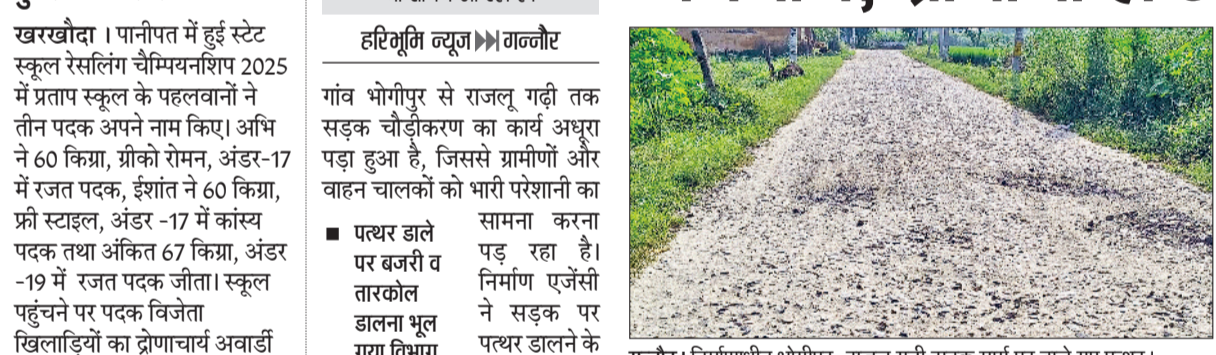
गन्नीर। निर्माणाधीन भोगीपुर-राजलू गढ़ी सड़क मार्ग पर डाले गए पत्थर।

हो चुका है, लेकिन ठेकेदार ने केवल गांव के पास टाइलें बिछाई हैं। दोनों गांवों के बीच की सड़क पर केवल पत्थर डालकर कार्य छोड़ दिया गया है। इससे दोपहिया वाहन चालकों के