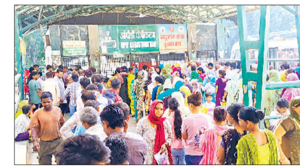
सोनीपत। अस्पताल में लगी मरीजों की लंबी लाइन तथा मॉडल टाउन स्थित स्कूल में बच्चों को जागरूक करते हुए।