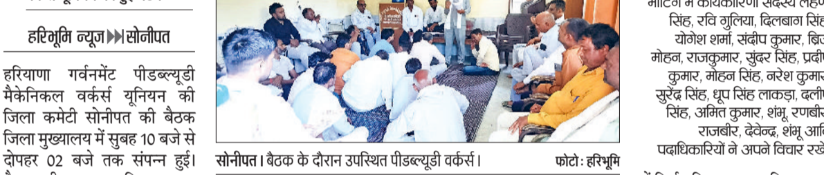
सोनीपत। बैठक के दौरान उपस्थित पीडब्ल्यूडी वर्कर्स।

गर्वनमेंट पीडब्ल्यूडी मैकेनिकल वर्कर्स यूनियन की हुई बैठक