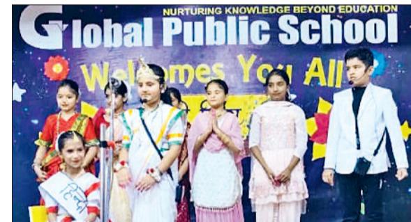
गोहाना। कार्यक्रम में प्रस्तुति देते हुए ग्लोबल पब्लिक स्कूल के विद्यार्थी।