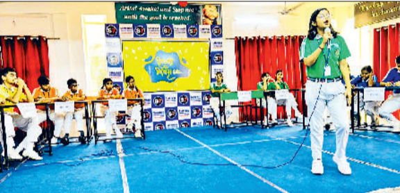
सोनीपत। एस-7 में आयोजित कार्यक्रम के दौरान प्रस्तुति देते विद्यार्थी।