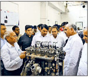
हरिभूमि न्यूज सोनीपत

अनियमितताओं पर समिति सदस्यों ने अपनाया कड़ा रुख